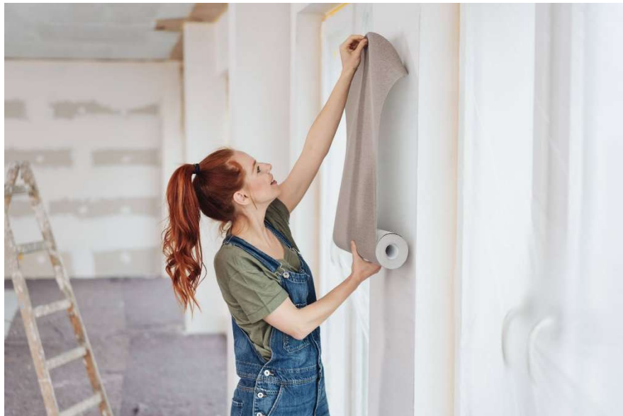
Referentiebeeld Wandafwerking Base Line, behangklaar

Voor alle details van de Luxury en Superior wand afwerking verwijzen wij naar de brochures van deze afbouw pakketten.